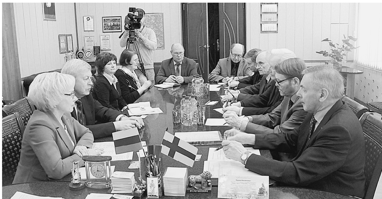
Встреча в администрации