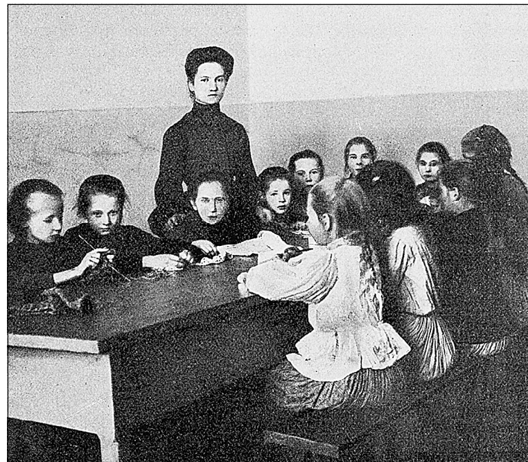
Суворовская школа. Класс рукоделия в образцовой школе

на, гречневая), квас и гороховый кисель. По воскресеньям ученики лакомились пирогами. В хлебе ограничений не было. Средства на содержание учи-